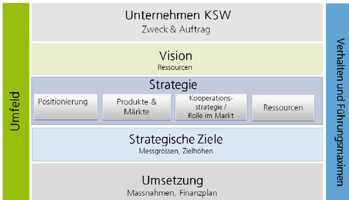
Abbildung 1: Struktur der Unternehmensstrategie des KSW

Veränderte Rahmenbedingungen bedingen eine Verifikation der bestehenden Unternehmenspolitik und Überarbeitung der Spitalstrategie